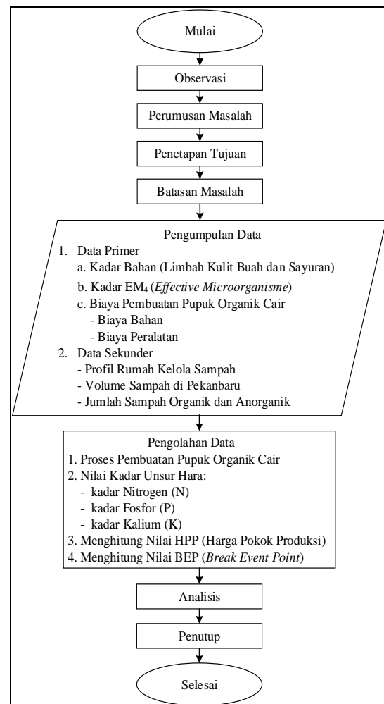
Gambar 1. Flowchart Penelitian

Metode penelitian merupakan langkah-langkah yang dilalui dalam melakukan penelitian. Adapun tahapan dapat dilihat pada Gambar 1.