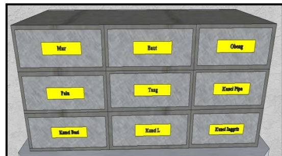
Gambar 3. Label Pada Lemari Penyimpanan