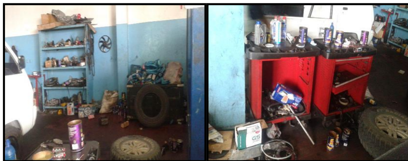
Gambar 1. Kondisi Area Kerja Engine Service & Repair PT. Jasa Barutama Perkasa

Ruangan kerja yang tidak begitu rapi dapat dilihat pada stasiun kerja engine service & repair sehingga terjadinya pengecilan volume stasiun kerja, berikut dokumentasi lingkungan area kerja PT. Jasa Barutama Perkasa, Pekanbaru, Riau.