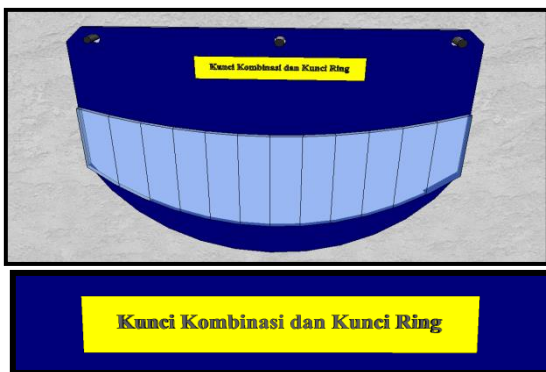
Gambar 2. Label Peletakkan Kunci-kunci