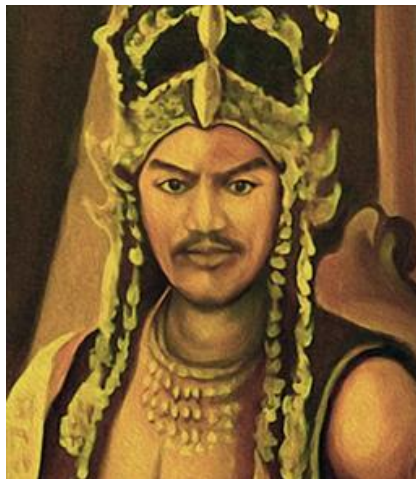
Gambar 1. Sribaduga Maharaja/Prabu Siliwangi

dalam aspek politik, ekonomi, dan kebudayaan, menjadikannya salah satu pusat peradaban penting di wilayah tersebut. Konstelasi kepemimpinan ini tidak hanya mencerminkan stabilitas politik, tetapi juga menunjukkan peran strategisnya dalam penguatan identitas kultural dan integrasi nilai-nilai tradisional dengan dinamika zaman. Penelitian kontemporer di bidang sejarah dan studi budaya menempatkan masa pemerintahannya sebagai era keemasan yang berperan dalam meletakkan dasar bagi perkembangan peradaban Sunda hingga masa modern.