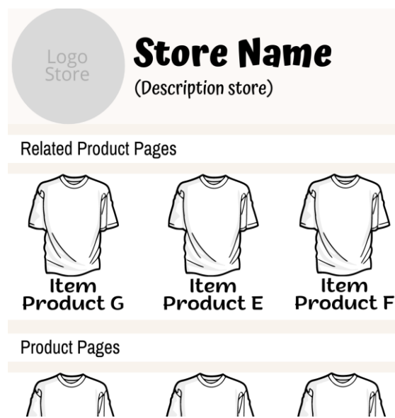
Gambar 2 Rekomendasi Laman Produk Terkait

Berdasarkan hasil Best Association Rules yang didapatkan, maka dapat dibuat strategi digital shelf management dalam penempatan produk pada e-commerce UMKM. Digital shelf assessment yang dapat dilakukan adalah dengan menampilkan produk terkait pada laman e-commerce. Secara teknis, tampilan laman e-commerce produk terkait yang diusulkan, dapat menempatkan produk E, produk F, dan produk G secara berdekatan sebagaimana Gambar 2. Produk E, F dan G diletakkan diposisi yang mudah dilihat oleh konsumen karena secara perilaku pembelian, misal di tampilan paling atas, karena produk tersebut merupakan produk yang sering dibeli secara bersamaan.