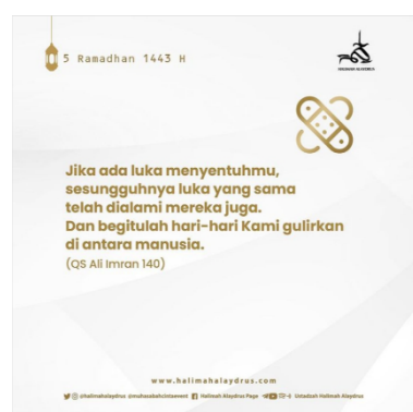
Surah Al Imran ayat 140

Pada postingan ini Halimah Alaydrus mencuplik terjemahan surah Qaf ayat 16. 34 Dengan hashtag yang dibawanya yaitu #healingalquran , ia menyampaikan kepada audience untuk tidak merasa sendiri, kalimat al-warid ini bukan bermaksud bahwa Allah menyatu dengan diri manusia, melainkan sebagaimana penjelasan Ibnu Asyur 35 , bahwa kedekatan dan kehadiran Allah melalui Pengetahuan-Nya dan manusia tidak bisa merasakannya.