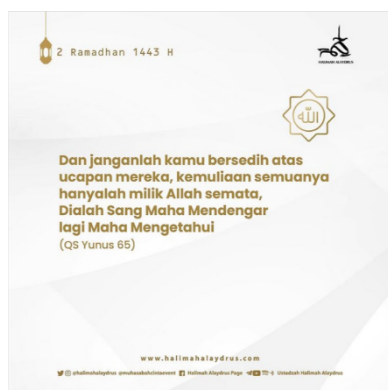
Surah Yunus Ayat 65

Sebagai Surah Al Imran ayat 140. 36 yang menerangkan tentang pedihnya luka yang hadapi umat manusia. secara tidak langsung, penggambaran ia terhadap ayat ini adalah melirik kejadian perang Uhud. Dimana sudah menjadi Sunnatullah, adanya kepedihan yang dihadapi manusia menjadi bentuk ujian dari Allah untuk mengangkat derajat manusia. 37