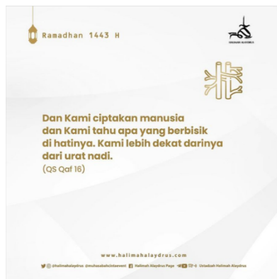
Surah Qaf ayat 16

Pada postingan ini Halimah Alaydrus mencuplik terjemahan surah Qaf ayat 16. 34 Dengan hashtag yang dibawanya yaitu #healingalquran , ia menyampaikan kepada audience untuk tidak merasa sendiri, kalimat al-warid ini bukan bermaksud bahwa Allah menyatu dengan diri manusia, melainkan sebagaimana penjelasan Ibnu Asyur 35 , bahwa kedekatan dan kehadiran Allah melalui Pengetahuan-Nya dan manusia tidak bisa merasakannya.