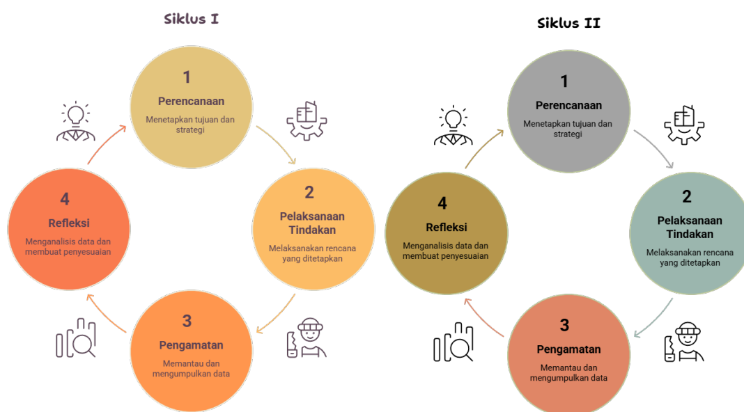
Gambar 1. Siklus Penelitian Tindakan Kelas

( planning ), (2) pelaksanaan tindakan ( acting ), (3) pengamatan ( observing ), dan (4) refleksi ( reflecting ) (Dahlani, 2019). Penerapan model ini memungkinkan peneliti untuk terus mengevaluasi dan menyempurnakan strategi pembelajaran secara dinamis, sehingga hambatan yang ditemukan pada satu siklus dapat segera diatasi pada siklus berikutnya guna mencapai hasil belajar yang optimal.