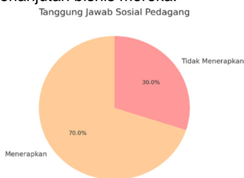
Gambar A.3 Tanggung Jawab Sosial Pedagang

Temuan lain yang signifikan dari grafik berikut ini adalah bahwa para pedagang di Pasar Buah Serumpun memiliki tingkat kesadaran sosial yang tinggi. Tanggung jawab sosial pedagang menjadi modal terbaik dalam menjalankan keberlanjutan bisnis mereka.