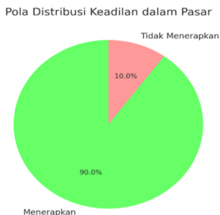
Gambar A.4 Pola Distribusi Keadilan dalam Pasar

Penelitian juga menemukan bahwa pola distribusi kekayaan di Pasar Buah Serumpun cenderung lebih merata dibandingkan dengan pasar-pasar modern, di mana praktik monopoli lebih umum terjadi.