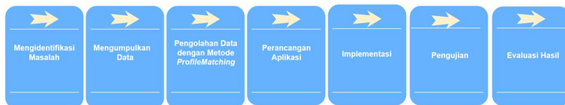
Gambar 1. Tahapan Penelitian

Metode penelitian memberikan gambaran rancangan dan tahapan penelitian secara umum. Perancangan perangkat lunak menggunakan Unified Modelling Language . Unified Modelling Language merupakan alat perancangan sistem yang berorientasi pada objek[6]. UML digunakan oleh para pengembang sebagai sarana untuk mengkomunikasikan idenya kepada para pemrogram serta calon pengguna suatu sistem atau perangkat lunak. Penelitian ini memiliki beberapa tahapan yang dijelaskan pada gambar berikut.