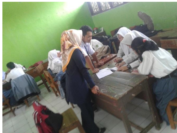
Gambar 1. Kegiatan pembelajaran Model Eliciting Activities

Kegiatan pembelajaran kedua kelas berlangsung dalam waktu yang sama yaitu selama 4 kali pertemuan. Kedua kelas, kegiatan pembelajaran kondusif, aktif dan para siswa bersemangat untuk mengikuti proses pembelajaran dengan menggunakan Model Eliciting Activities dan Discovery Learning , terlihat pada gambar 1 dan gambar 2 sebagai berikut: