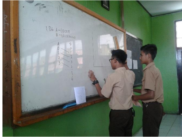
Gambar 2. Kegiatan pembelajaran Discovery Learning

Selama dilakukannya penelitian, peneliti menemukan beberapa kelebihan dan kekurangan dari kegiatan pembelajaran yang menggunakan Model Eliciting Activities . Kelebihan yang peneliti temukan dalam kegiatan pembelajaran selama menggunakan pembelajaran Model Eliciting Activities , yaitu: