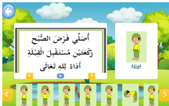
Gambar 6. Halaman Tatacara Shalat

Gambar 6 merupakan alur masuk menu tatacara shalat dalam media pembelajaran makhrjal huruf hijaiyah. Untuk masuk ke menu tatacara shalat, pengguna atau user masuk kehalaman Home (Gambar 3) kemudian memilih menu pembelajaran lalu pengguna atau user memilih kategori tatacara shalat yang akan dipilih (Gambar 4) merupakan halaman yang menampilkan tentang pembelajaran tatacara shalat.