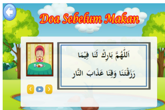
Gambar 8. Halaman Doa Sehari-hari

Gambar 8 merupakan alur masuk doa sehari-hari dalam media pembelajaran makhrjal huruf hijaiyah. Untuk masuk ke menu doa sehari-hari, pengguna atau user masuk kehalaman Home (Gambar 3) kemudian memilih menu pembelajaran lalu pengguna atau user memilih kategori doa sehari-hari yang akan dipilih (Gambar 4) merupakan halaman yang menampilkan tentang pembelajaran doa sehari-hari.