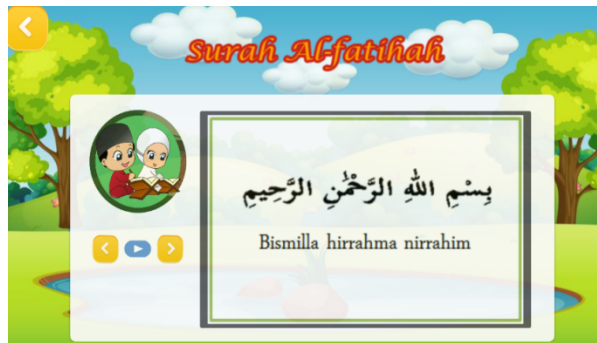
Gambar 7. Halaman Surah Pendek

Gambar 7 merupakan alur masuk surah pendek dalam media pembelajaran makhrjal huruf hijaiyah. Untuk masuk ke menu surah pendek, pengguna atau user masuk kehalaman Home (Gambar 3) kemudian memilih menu pembelajaran lalu pengguna atau user memilih kategori surah pendek yang akan dipilih (Gambar 4) merupakan halaman yang menampilkan tentang pembelajaran surah pendek.