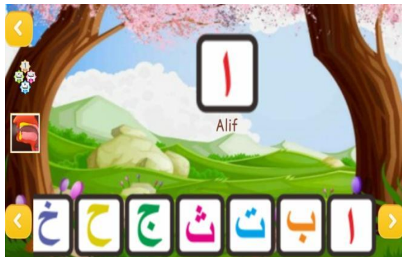
Gambar 5. Halaman Huruf Hijaiyah

Gambar 6 merupakan alur masuk menu tatacara shalat dalam media pembelajaran makhrjal huruf hijaiyah. Untuk masuk ke menu tatacara shalat, pengguna atau user masuk kehalaman Home (Gambar 3) kemudian memilih menu pembelajaran lalu pengguna atau user memilih kategori tatacara shalat yang akan dipilih (Gambar 4) merupakan halaman yang menampilkan tentang pembelajaran tatacara shalat.