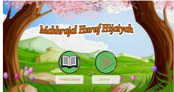
Gambar 3. Halaman home

ditujukan pada TK Az-zahra Tambusai Utara untuk guru. Guru dapat masuk kedalam media dengan memilih button Pembelajaran dan latihan.