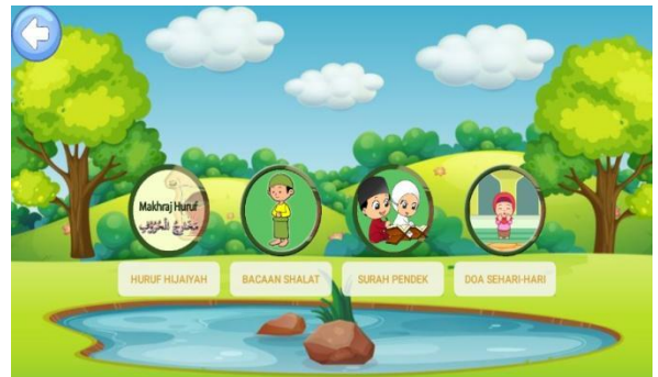
Gambar 4. Halaman Pembelajaran

Gambar 4 merupakan tampilan menu pembelajaran media pembelajaran makhrajal huruf hijaiyah. Pengguna atau user dapat masuk kedalam media dengan memilih menu pembelajaran untuk memulai belajar dengan menggunakan media pembelajaran tersebut.