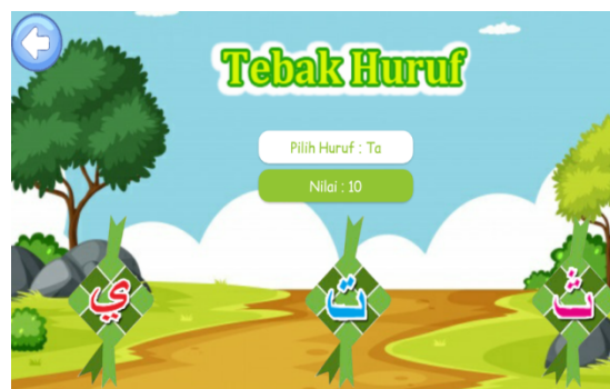
Gambar 9. Halaman Latihan

Gambar 9 merupakan tampilan menu latihan media pembelajaran makhrjal huruf hijaiyah. Pengguna atau user dapat masuk kedalam media dengan memilih menu latihan untuk uji kemampuan siswa-siswi TK Az-zahra dengan menggunakan media pembelajaran tersebut.