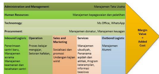
Gambar 2 Model Value Chain Pondok Pesantren Al-Uswah

Identifikasi proses bisnis menggunakan analisa Value Chain, berdasarkan tupoksi pesantren yang terdiri dari proses bisnis utama (primary activity) dan proses bisnis pendukung (support activity), seperti Gambar 2 berikut: