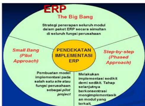
Gambar B.1 Pendekatan Implementasi ERP

Pembuatan model implementasi pada salah satu site ataupun guna industri bagaikan pilot project serta diteruskan ke guna ataupun site yang terpaut. Kelebihannya merupakan bayaran relatif rendah, kompleksitas menurun. Kekurangannya merupakan memerlukan banyak kostumisasi akibat terdapatnya pembedahan khusus antar site .