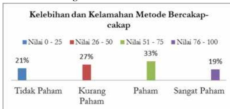
Gambar 6. Persentase Pengetahuan Guru PAUD tentang Kelebihan dan Kelemahan Metode Bercakap-cakap, di Kecamatan Labuhan Ratu.

Berdasarkan data yang peneliti peroleh, dari instrumen tes (pilihan ganda) 4 butir pertanyaan tentang kelebihan dan kelemahan metode bercakap-cakap, diperoleh nilai tertinggi 100 dan nilai terendah 0. Kemudian peneliti mencari kelas interval dengan 4 kategori. Pengetahuan guru paud tentang kelebihan dan kelemahan metode bercakap-cakap, terdapat 9 guru dengan kategori sangat paham (19% dari 48 guru), 16 guru dengan kategori paham (33%), 13 guru dengan kategori kurang paham (27%), dan 10 guru masuk pada kategori tidak paham (21%). Berdasarkan hasil penelitian, dapat dilihat bahwasannya pengetahuan guru PAUD terkait dengan kelebihan dan kelemahan metode bercakap-cakap berada pada tingkatan paham dengan indeks persentase yaitu sebesar 33%. Hasil keseluruhan yang diperoleh yaitu sebagian besar guru PAUD paham akan metode bercakap-cakap, pada pembelajaran di PAUD, dengan persentase sangat paham 34%, paham sebanyak 39%, kurang paham sebanyak 18%, dan kategori tidak paham sebanyak 9%.