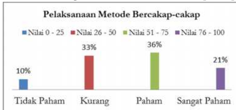
Gambar. 4 Persentase Pengetahuan Guru PAUD tentang Pelaksanaan Metode Bercakap-cakap, di Kecamatan Labuhan Ratu.

Berdasarkan data yang peneliti peroleh, dari instrumen tes (pilihan ganda) 7 butir pertanyaan tentang pelaksanaan metode bercakap-cakap, diperoleh nilai tertinggi 100 dan nilai terendah 0. Kemudian peneliti mencari kelas interval dengan 4 kategori. Pengetahuan guru paud tentang pelaksanaan metode bercakap-cakap, terdapat 10 guru dengan kategori sangat paham (21% dari 48 guru), 17 guru dengan kategori paham (36%), 16 guru dengan kategori kurang paham (33%), dan 5 guru masuk pada kategori tidak paham (10%). Berdasarkan hasil penelitian, dapat dilihat bahwasannya pengetahuan guru PAUD terkait dengan pelaksanaan metode bercakap-cakap berada pada tingkatan paham dengan indeks persentase yaitu sebesar 36%.