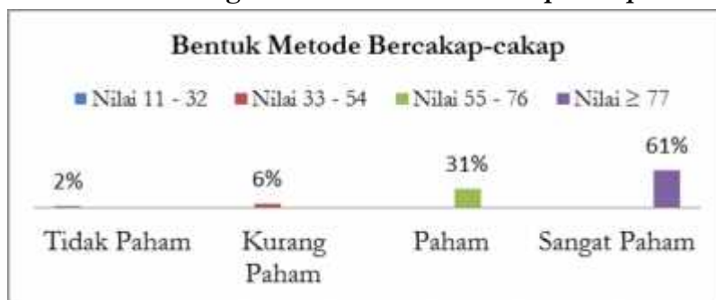
Gambar 3. Persentase Pengetahuan Guru PAUD tentang Bentuk Metode Bercakap-cakap, di Kecamatan Labuhan Ratu.

Berdasarkan data yang peneliti peroleh, dari instrumen tes (pilihan ganda) 9 butir pertanyaan tentang pengertian metode bercakap-cakap, diperoleh nilai tertinggi 100 dan nilai terendah 11. Kemudian peneliti mencari kelas interval dengan 4 kategori. Pengetahuan guru paud tentang bentuk metode bercakap-cakap, terdapat 29 guru dengan kategori sangat paham (61% dari 48 guru), 15 guru dengan kategori paham (31%), 3 guru dengan kategori kurang paham (6%), dan 1 guru masuk pada kategori tidak paham (2%). Berdasarkan hasil penelitian, dapat dilihat bahwasannya pengetahuan guru PAUD terkait dengan bentuk metode bercakap-cakap pada pembelajaran di PAUD berada pada tingkatan sangat paham dengan indeks persentase yaitu sebesar 61%.