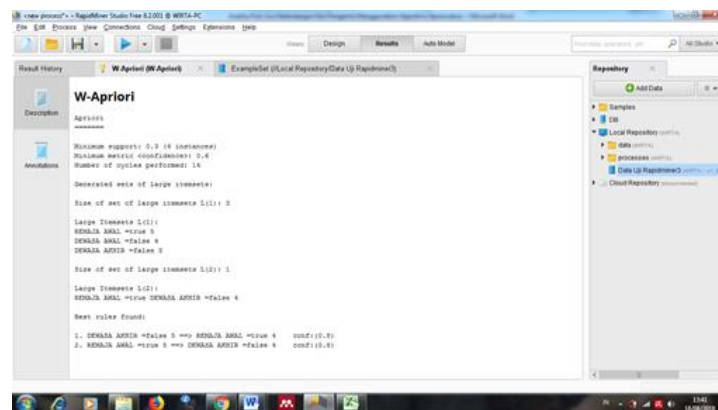
Gambar 5. Hasil Running Algoritma Apriori

Hasil running Algoritma Apriori merupakan hasil data berupa rules . Hasil running dapat dilihat dengan mengklik tab results atau F9 pada keyboard , maka akan tampil 3 tab ( Result History , W-Apriori , ExampleSet ). Tab Result History adalah tab yang menampilkan history proses Algoritma Apriori, tab W-Apriori adalah tab yang menampilkan hasil algoritma apriori berupa rules , dan tab ExampleSet menampilkan data tabular yang digunakan[10]. Proses ini dapat dilihat pada gambar 5.