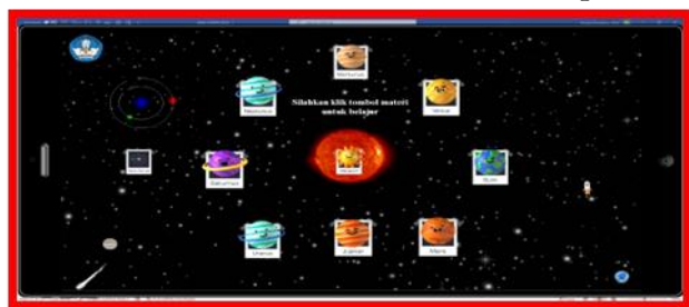
Gambar 6. Desain Halaman Menu Utama Multimedia Pembelajaran Interaktif materi Tata Surya Pembuatan desain ujian

Pada menu utama materi ini setiap icon berisi materi sesuai dengan nama icon yang tersedia misalnya icon matahari jika di klik akan muncul materi terkait dengan matahari