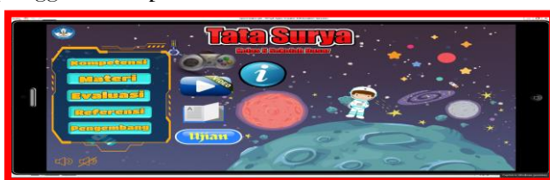
Gambar 4. Desain halaman Utama Multimedia Pembelajaran Interaktif materi Tata Surya Pembuatan desain petunjuk atau informasi penggunaan aplikasi

Tampilan setelah masuk ke menu utama terdiri dari sebelah kiri atas logo tutwuri handayani, Judul Multimedia Pembelajaran Interaktif. tombol navigasi seperti kompetensi, materi, evaluasi, referensi, pengembang, tombol games, tombol video, tombol resume, tombol ujian, dan tombol informasi atau petunjuk penggunaan aplikasi