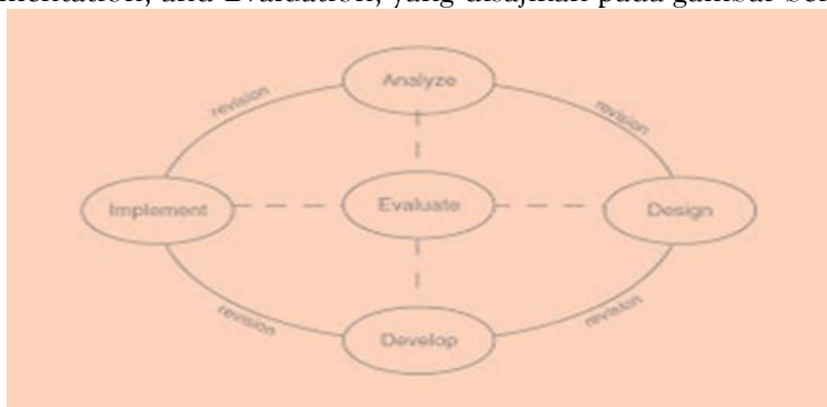
Gambar 2. Desain Pengembangan Model ADDIE

Model ADDIE menggunakan lima tahap pengembangan yang meliputi Analysis, Design, Development, Implementation, and Evaluation, yang disajikan pada gambar berikut