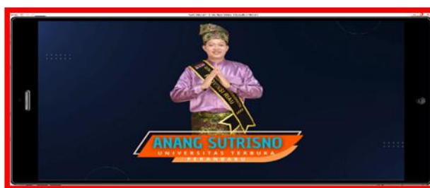
Gambar 3. Desain Intro Multimedia Pembelajaran Interaktif materi Tata Surya untuk sekolah dasar