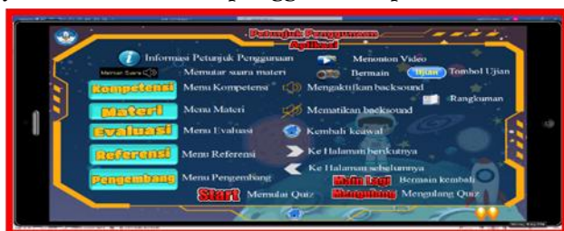
Gambar 5. Desain Halaman Informasi/Petunjuk Multimedia Pembelajaran Pembuatan desain materi pembelajaran

Pada menu utama materi ini setiap icon berisi materi sesuai dengan nama icon yang tersedia misalnya icon matahari jika di klik akan muncul materi terkait dengan matahari