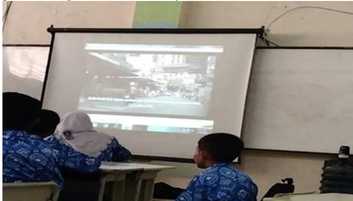
Gambar 2. Media Video Pembelajaran

Video pembelajaran merupakan salah satu bentuk media audiovisual yang memiliki kemampuan untuk menampilkan objek yang bergerak seiring dengan suara yang alamiah atau sesuai dengan konteksnya (Pagarra et al., 2022). Video pembelajaran adalah alat yang sangat efektif dalam menyampaikan informasi dan memfasilitasi proses pembelajaran. Melalui video, materi pembelajaran dapat disajikan dengan cara yang lebih menarik dan mudah dipahami oleh para siswa. Di samping itu, penerapan video pembelajaran dapat diakses kapan saja dan di mana saja sesuai dengan kebutuhan. Sehingga sebagaimana yang dinyatakan oleh Mayer dalam (Khairani, Sutisna, & Suyanto, 2019), penerapan media video pembelajaran memiliki keunggulan yang signifikan dalam meningkatkan hasil belajar siswa. Media video pembelajaran dapat membuat para siswa lebih termotivasi dalam belajar, yang pada akhirnya dapat meningkatkan hasil belajar mereka.