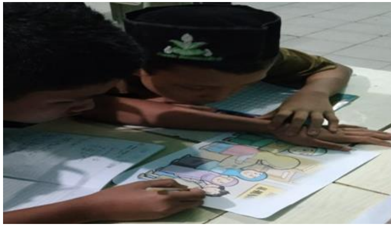
Gambar 3. Media Gambar

Berdasarkan temuan data penelitian, penerapan media gambar oleh guru PAI di SMP Muhammadiyah 01 Medan terbukti menjadi salah satu media pembelajaran yang efektif dalam meningkatkan daya pikir siswa. Dengan penerapan media ini, siswa dapat menginterpretasikan makna dari gambar yang disajikan. Selain itu, penerapan gambar yang kreatif dapat membangkitkan minat siswa dan membuat mereka lebih aktif serta terlibat dalam proses pembelajaran. Sebelum menerapkan media gambar sebagai sarana dalam pembelajaran, guru lebih awal telah melakukan persiapan dengan merancang gambar-gambar yang sesuai dengan materi pembelajaran. Hal ini bertujuan untuk memastikan bahwa gambar-gambar yang akan disajikan kepada para siswa nantinya dapat mendukung pesan yang disampaikan dengan jelas dan tidak menimbulkan kebingungan atau kesalahpahaman. Dalam menerapkan media ini, guru akan membentuk kelompok belajar agar suasana pembelajaran menjadi kolaboratif dan interaktif.