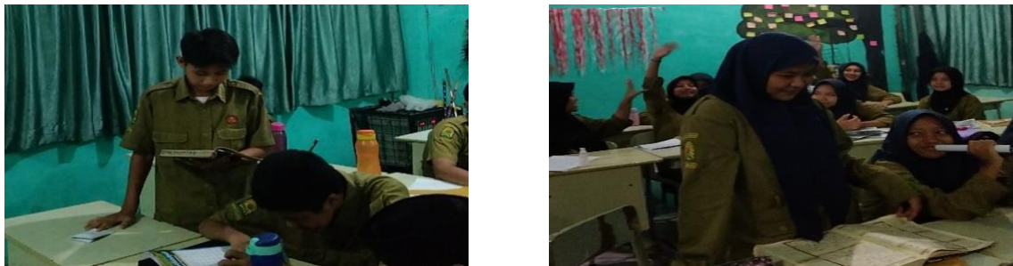
Gambar 5. Media Games Edukasi

Menurut Ariesto Hadi Soetopo dalam (Dwiyono, 2017), salah satu metode yang efektif untuk menciptakan suasana pembelajaran yang santai dan mendorong siswa untuk belajar lebih aktif dalam memecahkan masalah adalah dengan memanfaatkan games edukasi sebagai media pembelajaran. Games edukasi sebagaimana yang dikemukakan oleh Novaliendry dalam (Yulianti & Ekohariani, 2020), adalah games yang telah dirancang secara khusus untuk membimbing siswa atau pengguna ke arah pembelajaran yang telah ditentukan, meningkatkan pemahaman konsep, memberikan pelajaran, mengembangkan keterampilan, dan mendorong keterlibatan aktif dalam memainkannya. Dalam menerapkan games edukasi sebagai media pembelajaran, guru dapat menyesuaikan materi pembelajaran dan tingkat kesulitan sesuai dengan kebutuhan dan kemampuan para siswa.