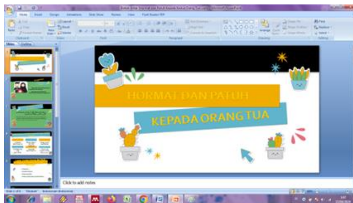
Gambar 1. Media PowerPoint

Kemajuan teknologi yang pesat telah menghasilkan banyak program komputer ( software ) yang dapat dijadikan sebagai sarana dalam pembelajaran. Salah satu program yang sering digunakan dan umumnya mudah untuk menyajikan materi pembelajaran adalah PowerPoint (Batubara et al., 2023). Sebagaimana yang dikemukakan oleh Nurhidayati dalam (Wahyuni, Rahmadhani, & Mandasari, 2020) program PowerPoint merupakan media yang digunakan untuk menyampaikan poin-poin penting dari materi dengan berbagai fitur yang menarik. Fitur-fitur yang ada memfasilitasi penggunaan berbagai jenis gaya belajar siswa, seperti gaya belajar visual, audio, kinestetik, dan verbal. Dengan menggunakan PowerPoint, seseorang dapat dengan mudah merancang bahan presentasi dalam bentuk slide . Presentasi dapat dibuat dengan tampilan profesional yang sesuai untuk digunakan sebagai materi pembelajaran (Hasanah, 2020). Dalam proses pembelajaran, penerapan PowerPoint tidak hanya terbatas pada guru, tetapi juga dapat digunakan oleh para siswa. Contohnya, guru membentuk kelompok belajar, lalu memberikan tantangan yang berkaitan dengan materi pembelajaran, dan kemudian meminta siswa untuk menyelesaikan tantangan tersebut serta menyampaikannya di depan kelas melalui presentasi (Hafizah, 2023). Dengan begitu, siswa dapat menunjukkan pemahaman mereka terhadap materi pembelajaran.