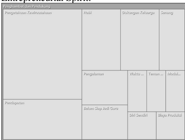
Gambar 2. Diagram Hierarki Faktor Yang Mempengaruhi Entrepreneurial Spirit

Data faktor yang mempengaruhi Entrepreneurial Spirit melalui diagram hierarki untuk melihat faktor apa saja yang sering disebut oleh ketiga informan. Berikut gambar diagram hierarki faktor yang mempengaruhi Entrepreneurial Spirit: