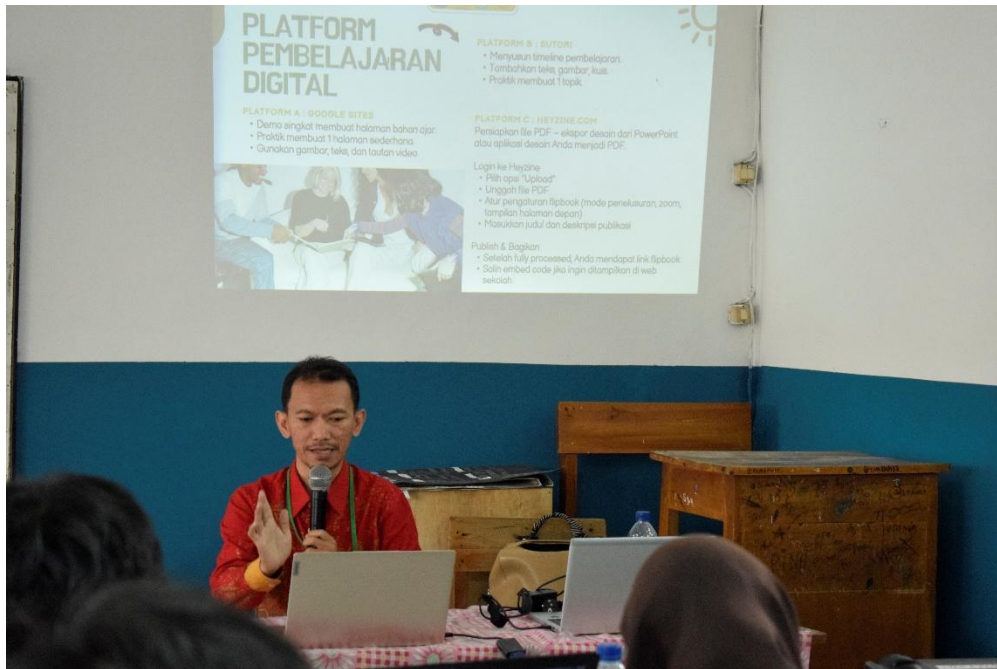
Gambar 1. Kegiatan Penyampaian Materi

Berikut itu rekapitulasi hasil penyusunan bahan ajar digital dalam upaya perhtiungan pra dan pasca pelatihan penguatan kompetensi guru.