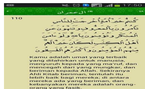
Contoh dakwah lewat Whatsaap :