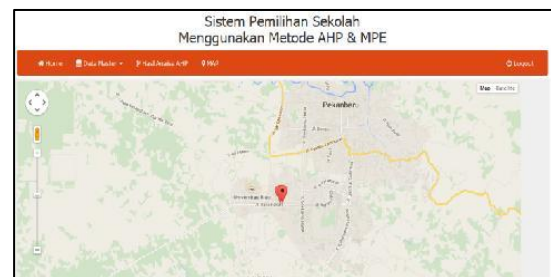
Gambar 6 Tampilan Menu Map