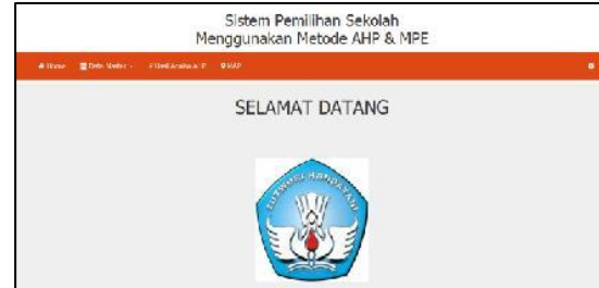
Gambar 4 Tampilan Menu Utama Administrator

Tampilan menu utama akan muncul setelah pengguna sistem melakukan login yang valid. Tampilan menu utama yang dapat diakses oleh admin adalah menu Data Master, Analisis dan melihat peta lokasi ( Map ).