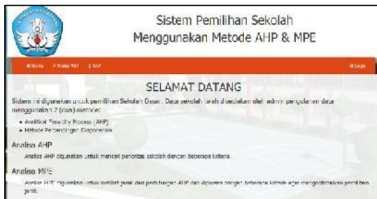
Gambar 1 Tampilan Menu USER

Pada penelitian ini pengujian dilakukan terhadap 2 koleksi dokumen uji, seperti dapat dilihat pada tabel 1 dan jumlah kelompok yang ingin dibentuk adalah sejumlah 4 dan 7 kelompok.