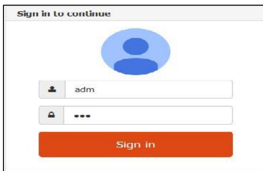
Gambar 3 Tampilan Menu LoginAdmin

Tampilan menu utama akan muncul setelah pengguna sistem melakukan login yang valid. Tampilan menu utama yang dapat diakses oleh admin adalah menu Data Master, Analisis dan melihat peta lokasi ( Map ).