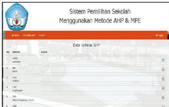
Gambar 2 Tampilan data kriteria AHP