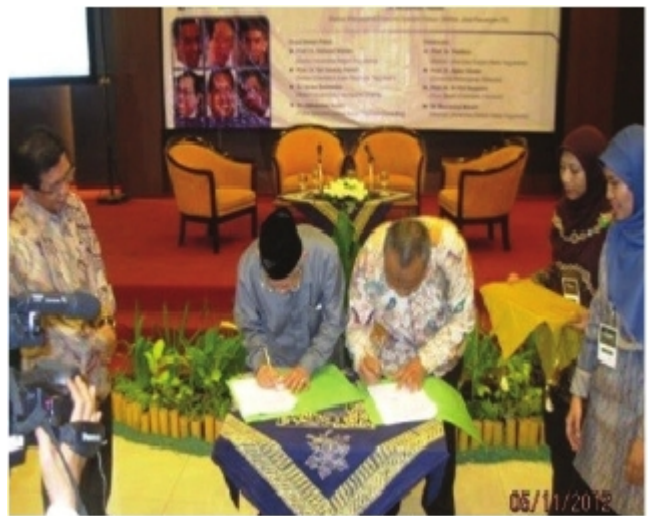
Signing MOU dengan Ketua Dewan Syariah Nasional KH. Dr. (H). Ma'ruf Amin disaksikan oleh Ketua OJK Bpk. Muliaman D. Haddad, pada Acara BMT Summit 2012 di Yogyakarta.