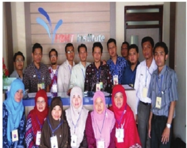
Peserta Pelatihan Kompetisi berfoto bersama di Kantor PBMT Institute, Yogyakarta.